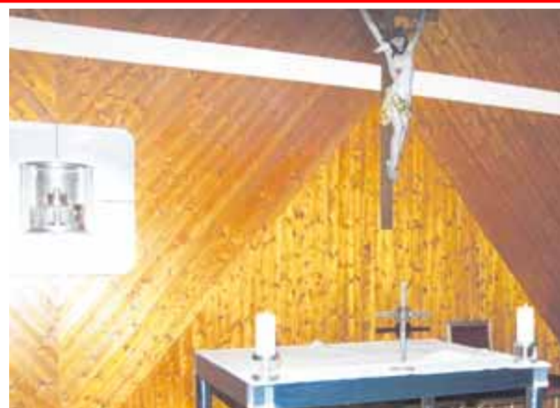
So sieht der Altarraum in der Kapelle im Caritas-Centrum Vöhringen im Augenblick aus. Am Samstag, 8. November, wird Weihbischof Losinger einen neuen Altar einweihen.

Weihbischof Losinger hat der Caritas schon ein Grußwort zur Altarweihe geschickt, in dem er auf die Bedeutung des Altars als „Mitte der Gemeinde und Mitte des Lebens der Gläubigen“ nachdrücklich hinweist. Der Bildhauer habe nach intensiven Planungen und Überlegungen in der Sprache der Architektur das auszudrückende vermocht. Das Caritas-